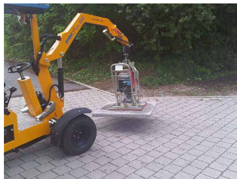
Ugradnja na drenažni beton